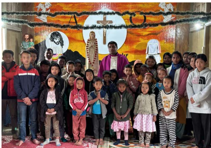
Rosa Mystica Schule in INDIA