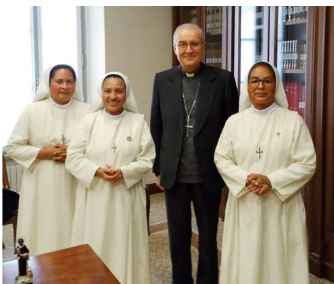
Schwestern aus Peru mit dem Bischof von Brescia