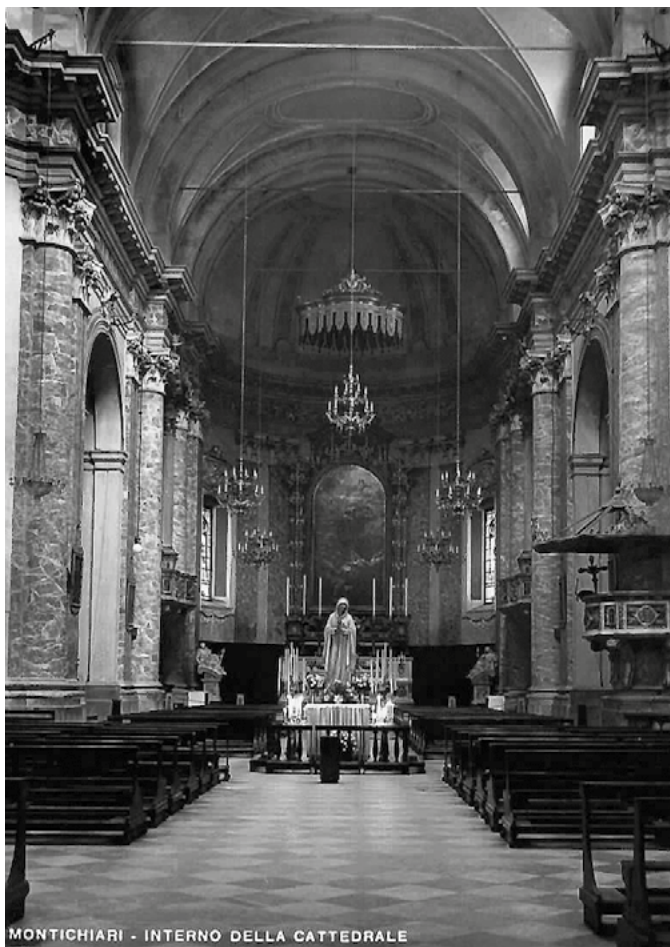
1954 - die Statue der Rosa Mystica, die im Mittelschiff der Kathedrale von Montichiari der Verehrung des Volkes ausgesetzt wird, gemäß dem Wunsch, den die Muttergottes selbst an Pierina äußerte.