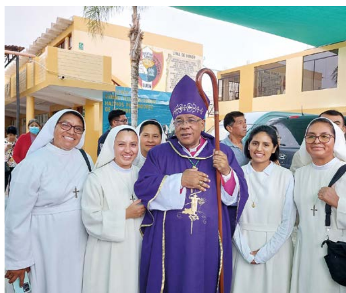
Schwestern aus Peru mit dem Ortsbischof