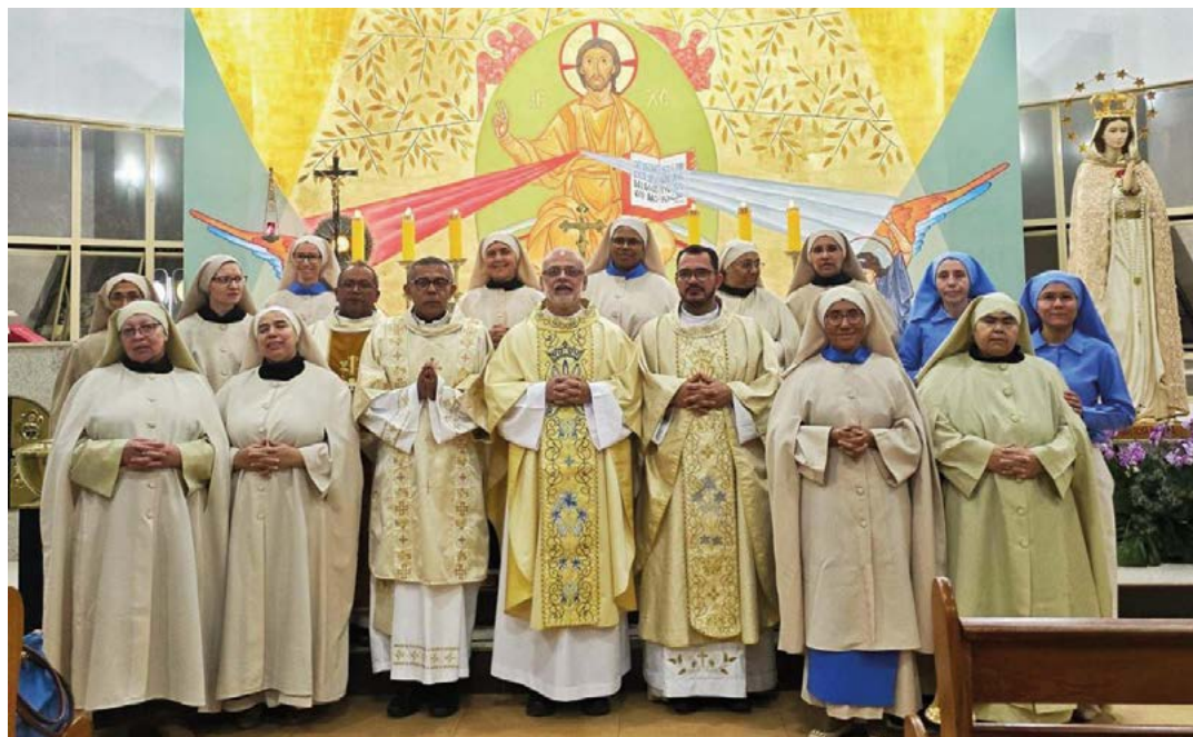
Eine Gruppe junger Missionare der Kongregation Maria Rosa Mystica, die vor zwanzig Jahren in Brasilien gegründet wurde.