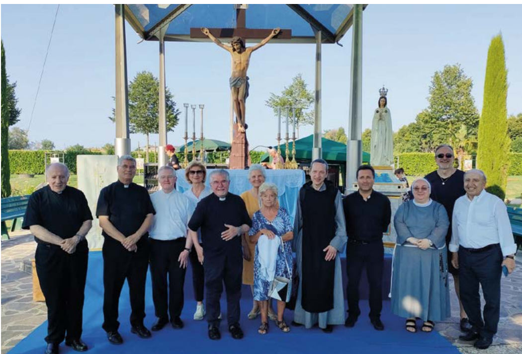
Mitglieder der Studienkommission in Fontanelle mit einigen Mitgliedern der Stiftung selbst.