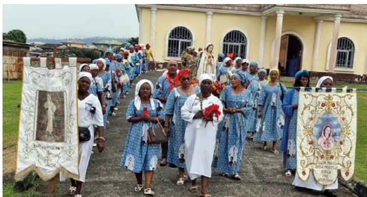
Gebetsgruppe aus einem afrikanischen Land