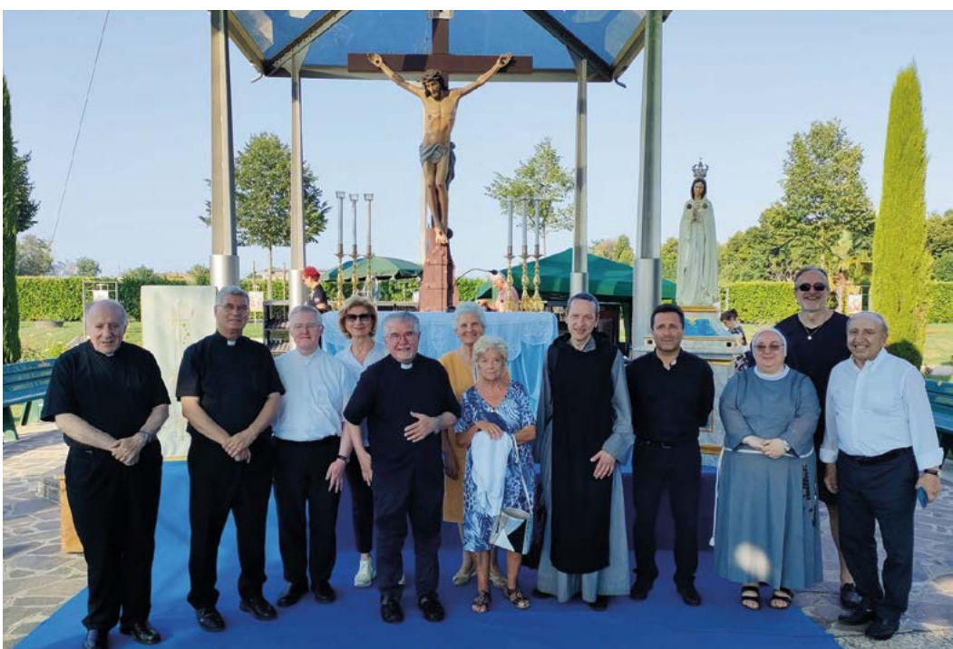
Membros da comissão de estudo de Fontanelle com alguns membros da Fundação