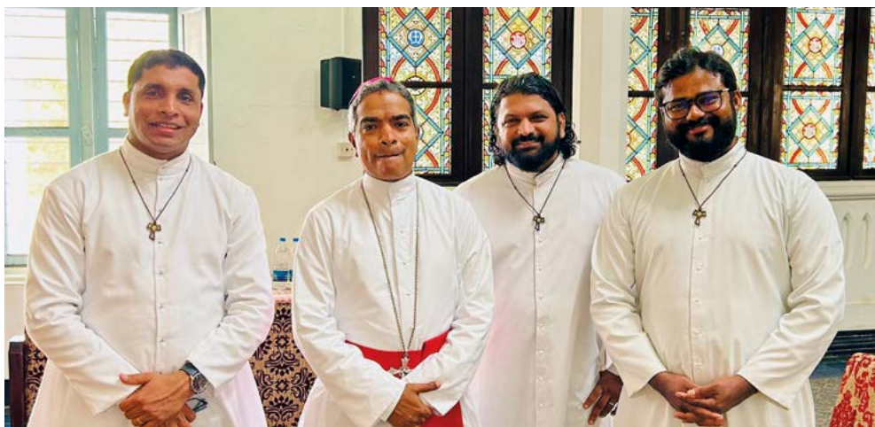
Padre Mathew, grande devoto e divulgador da devoção a Rosa Mística na Índia, com padres colaboradores

Sim, é isso mesmo. E aqui vamos abordar mais um aspecto importante, o da difusão do culto antes do reconhecimento, que é uma das razões pelas quais o atual Dicastério para a Doutrina da Fé considerou oportuno reconhecer este Santuário dedicado a Maria Rosa Mística e Mãe de a Igreja. Um tal reconhecimento tem ressonância universal.