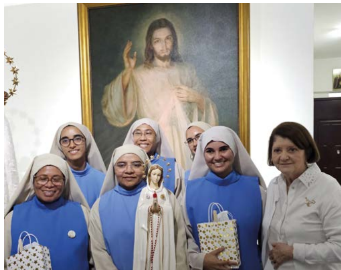
Panamá – Nova ordem religiosa feminina fundada sob o título de Rosa Mística

Mística, estendendo o convite também à Associação Rosa Mística Fontanelle de Montichiari e ao Bispo diocesano. Este Congresso realizado no Panamá, de 9 a 13 de outubro desse ano, está certamente destinado a marcar o ponto de partida para uma colaboração estreita e eficaz entre a Igreja de Bréscia e todos os devotos de Rosa Mística no mundo, graças também à disponibilidade