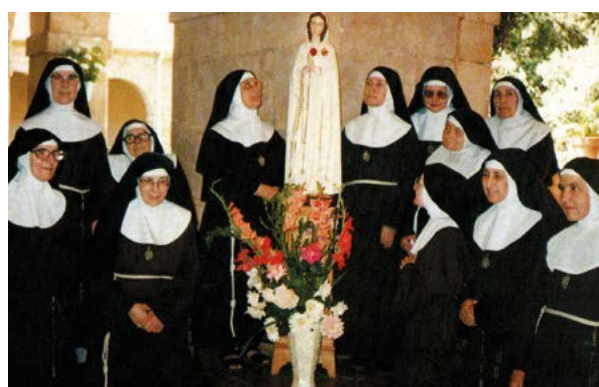
Grupo de oração de um país africano