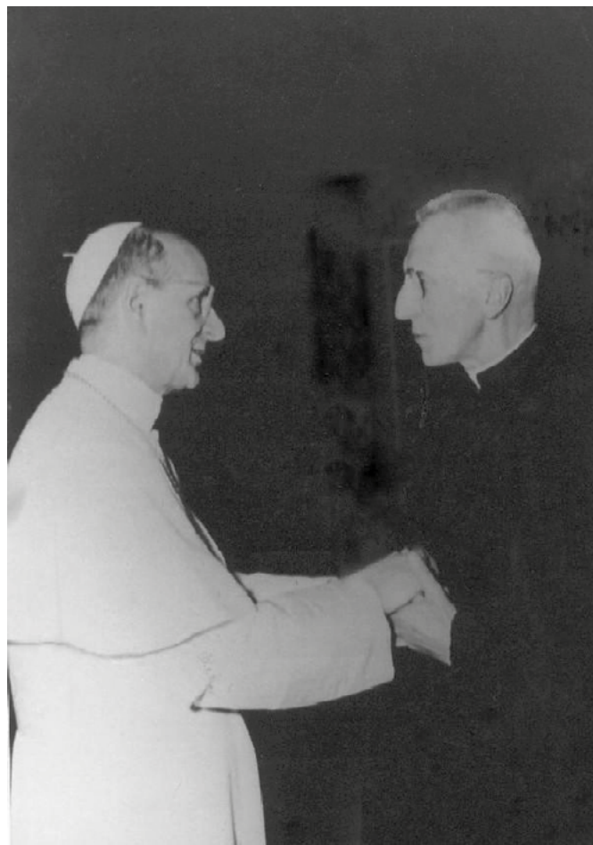
Mons. Francesco Rossi, pároco de Montichiari de 1949 a 1971 retratado com o Santo Papa Paulo VI, do qual foi colega durante os anos de seminário em Brescia