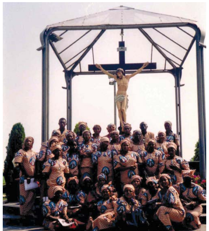
Desde a Guiné Equatorial em peregrinação a Fontanelle.