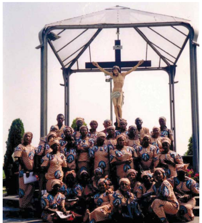
De Guinée équatoriale en pèlerinage à Fontanelle