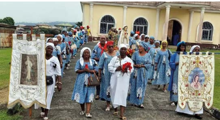
Groupe de prière d'un pays africain