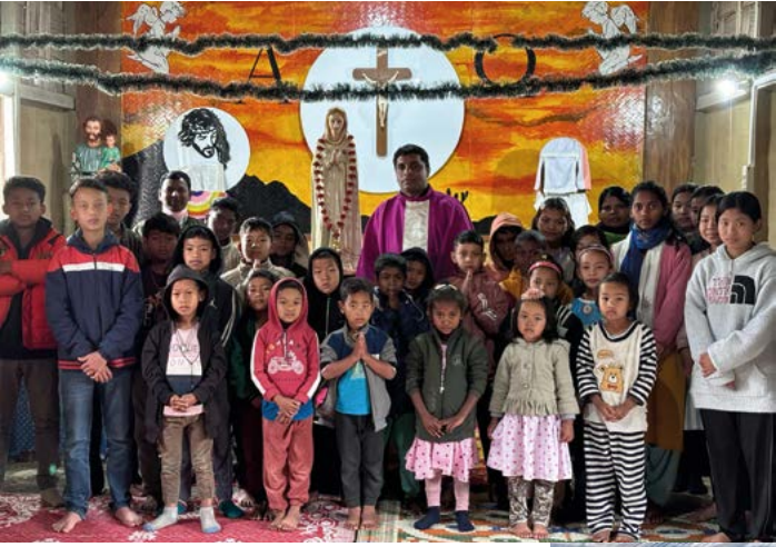
École Rosa Mystica en INDE