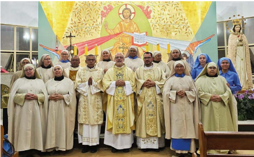
Les petites missionnaires de Maria Rosa Mystica : une congrégation fondée il y a vingt ans au Brésil