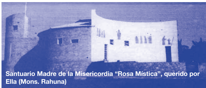
Santuario Madre de la Misericordia "Rosa Mística", querido por Ella (Mons. Rahuna)

■ DESDE BURUNDI - He aquí mis cuarenta años de misión con la Rosa Mística en Burundi . Son años de silencio, de amor y de dolor. Amor por el Padre, por Jesús y por María, que doy a conocer todos los días – Amor por los pequeños huérfanos abandonados – Amor por los pecadores que recibo en el confesionario todos los días – Amor por Jesús Eucarístico a quien adoramos y celebramos todos los días en los hospitales – Amor por Jesús Misericordioso, al que hago amar. Dolor por el silencio y las incomprensiones de la presencia de Rosa Mística , por no ser comprendida y acogida por sus hijos. Dolor por la pobreza y la imposibilidad de prestar ayuda a los muchos que tocan a nuestra puerta. He aquí mis cuarenta años juveniles de misiones para hacer Amar al Padre, al Hijo, a María, a la Cruz, a la Eucaristía, al Rosario, con el poder del Espíritu Santo.