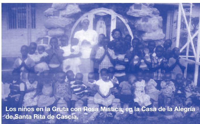
Los niños en la Gruta con Rosa Mística, en la Casa de la Alegría de Santa Rita de Cascia.