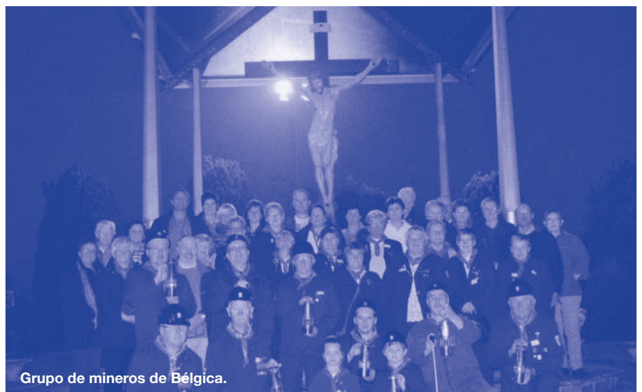
Grupo de mineros de Bélgica.