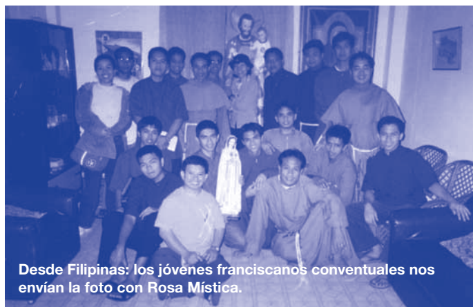
Desde Filipinas: los jóvenes franciscanos conventuales nos envían la foto con Rosa Mística.