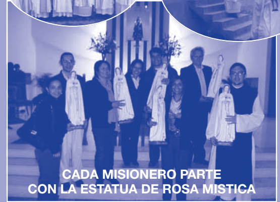
CADA MISIONERO PARTE CON LA ESTATUA DE ROSA MISTICA