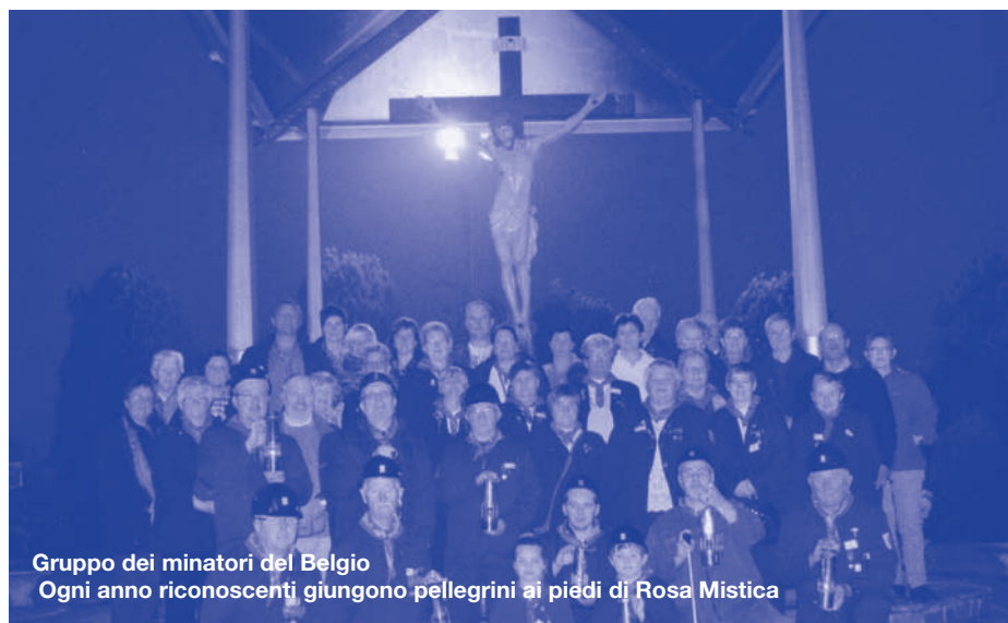
Gruppo dei minatori del Belgio Ogni anno riconoscenti giungono pellegrini ai piedi di Rosa Mistica