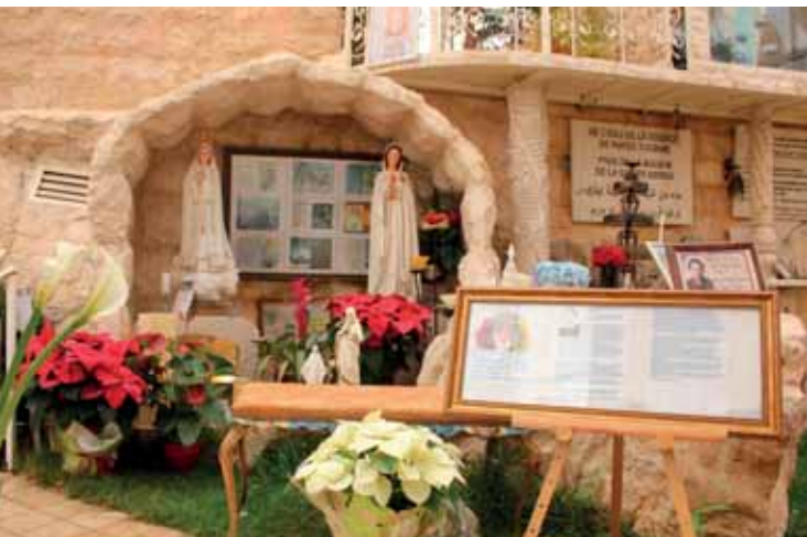
Benedizione con l'icona di Maria Rosa Mistica.