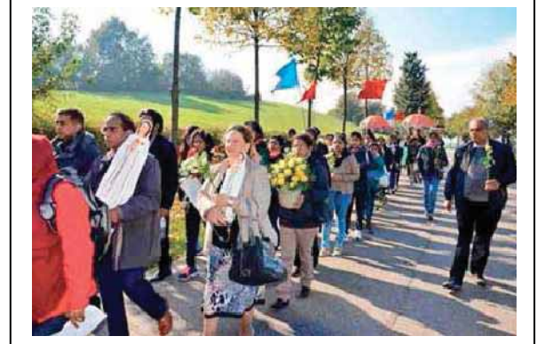
فونتانييل 1 و 2 تشرين الثاني 2014 عديد من تماثيل مريم الوردة السرية احضرتها عائلات هندية مقيمة في سويسرا وملتزمة بالحركة المريمية، اتوا الى فونتانييل وامضوا يومين في الصلاة.

سلام وحب وفرح ورحمة الرب يكونوا معنا جميعا في أسرنا، في الكنيسة وفي العالم. جمعية مريم الوردة السرية - فونتانييل